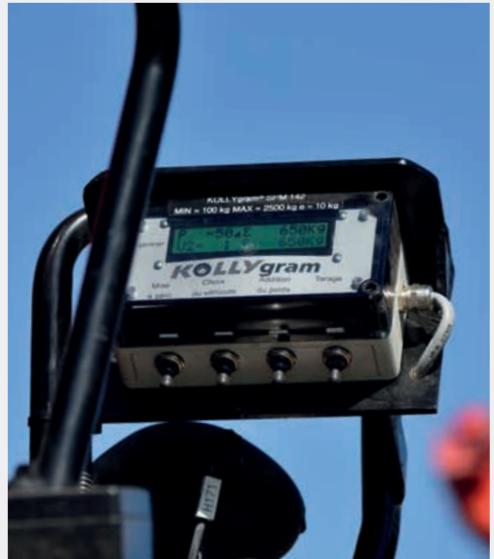
Commande avec afficheur (TC 234)