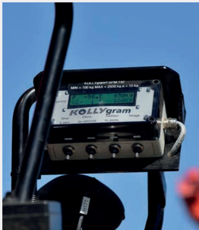
Steuerung mit Anzeige (TC 234)